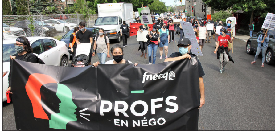
En juin, des enseignantes et enseignants de cégeps ont marché vers le bureau du ministère de l'Éducation et de l'Enseignement supérieur afin de demander que les futurs investissements répondent aux réels besoins.