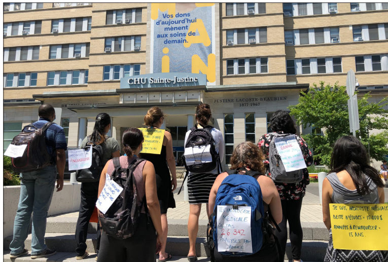
À la mi-juin, devant le CHU Sainte-Justine, les professionnel·les, techniciennes et techniciens membres du STEPSQ-FP en avaient gros sur le cœur... et sur les épaules! Au front pour de meilleures conditions!

Syndicat des employé-es de la Librairie Raffin Plaza Saint-Hubert - CSN