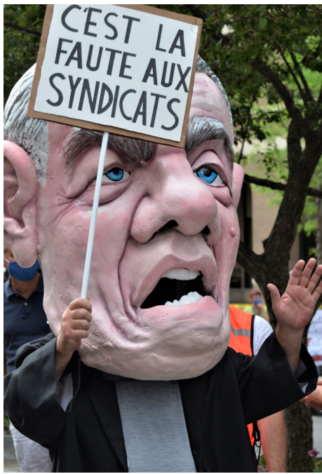
Première manifestation post-confinement, le 28 mai dernier, devant les bureaux du premier ministre Legault.